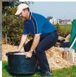
Figura 6 ... così come nel tempo libero.