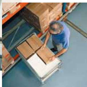
Figura 11 Quando spostate un peso da un lato all'altro, fate sempre un passo intermedio.