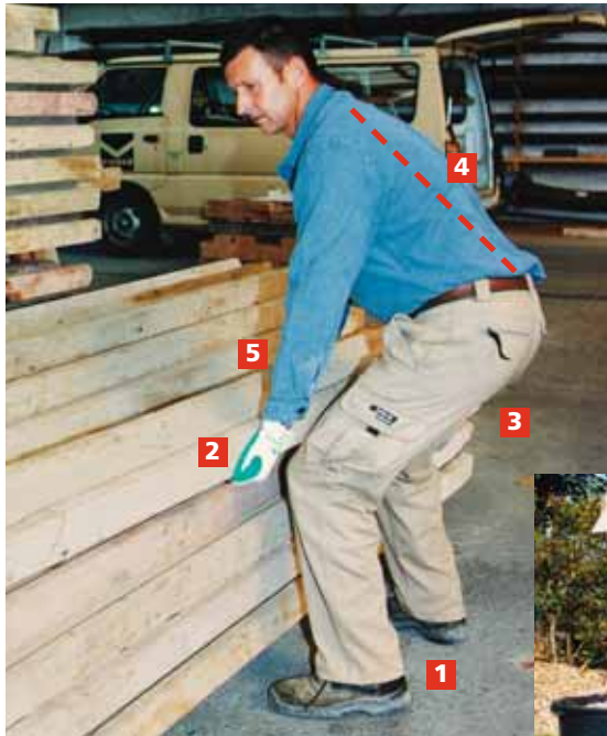
Figura 5 Sollevare i carichi nel modo corretto. Questo vale sul posto di lavoro ...