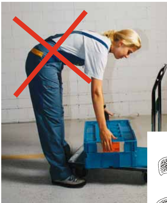
Figura 3 Sollevamento di un carico con la schiena curvata (tecnica scorretta).

Se si solleva un carico inarcando la schiena (tecnica scorretta) i dischi intervertebrali vengono deformati e compressi maggiormente sulla parte anteriore che posteriore. Quanto più forte è l'inclinazione del tronco in avanti e pesante il carico, tanto maggiore risulta il carico a danno dei dischi intervertebrali, con conseguenti traumi o lesioni alla schiena.