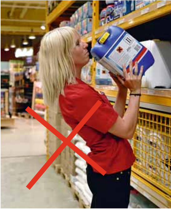
Figura 9 Evitare di inarcare la regione lombare. Questo succede quando il ripiano si trova troppo in alto (usare uno sgabello o una scaletta).