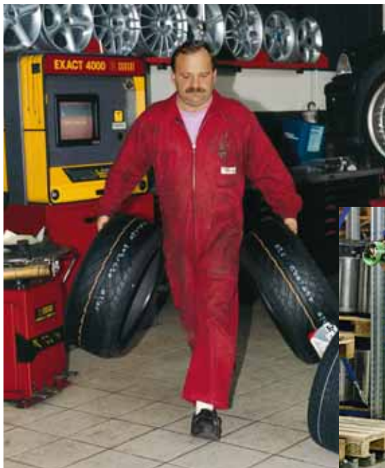
Figura 7 Se possibile, distribuire uniformemente il carico.

Anche quando si depone il carico la regola principale è flettere le gambe e tenere la schiena ben dritta.