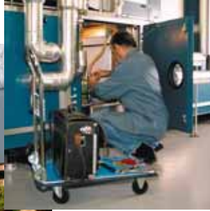
Figura 14 ... o una piattaforma.

Se non conoscete l'effettivo peso di un carico, è bene iniziare l'azione di sollevamento facendo un timido tentativo, ma con molta attenzione. Cercate di mantenere la corretta posizione del corpo (figura 5).