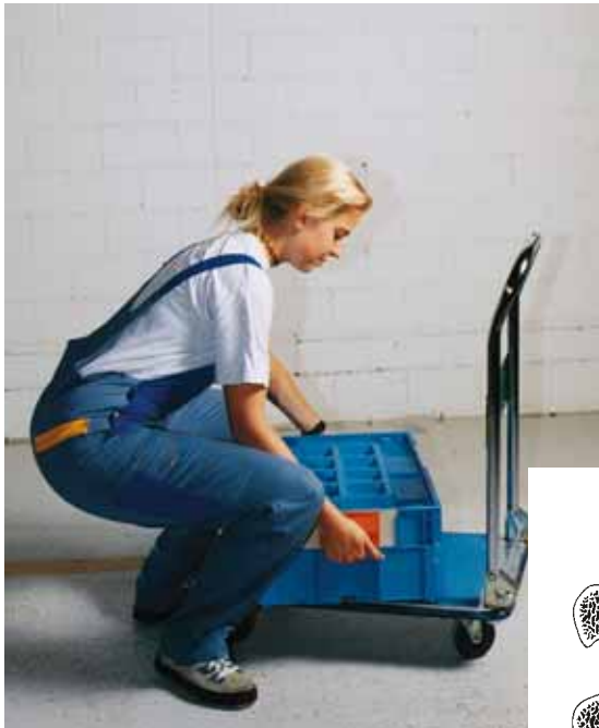
Figura 1 Se la tecnica di sollevamento è corretta la schiena deve essere diritta.