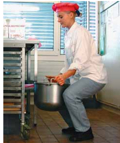
Figure 17 e 18

Chi conosce la corretta tecnica di sollevamento e trasporto o possiede muscoli allenati, ad es. gli sportivi, può sfruttare queste conoscenze anche sul posto di lavoro.