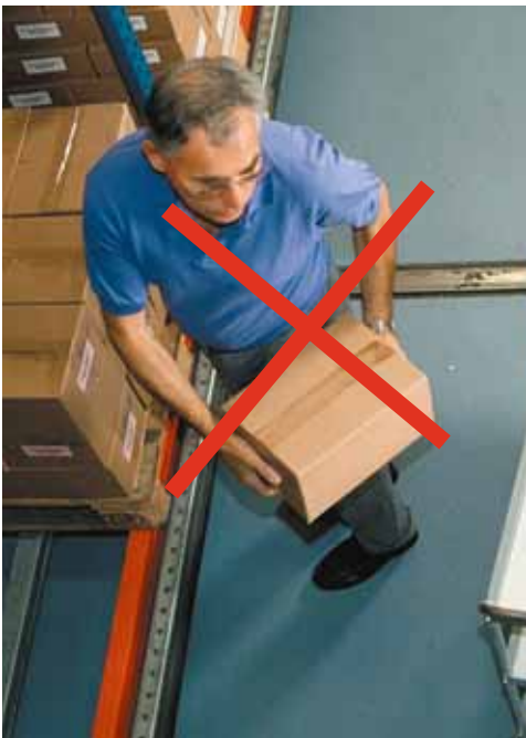
Figura 10 Quando si solleva e si depone un carico bisogna evitare assolutamente la torsione del busto.