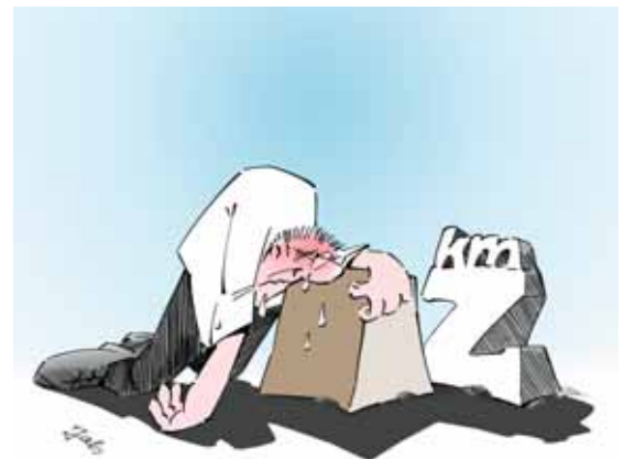
Figura 16 Anche i pesi più leggeri possono diventare faticosi se si devono percorrere tragitti molto lunghi. Pertanto, se il percorso è lungo, è consigliabile suddividere il peso. Ad esempio, se dobbiamo spostare un carico per 20 m, prendiamo solo la metà di quello che avremmo trasportato su una distanza di 2 m. Se il peso non si può dividere, è bene utilizzare un mezzo di trasporto.