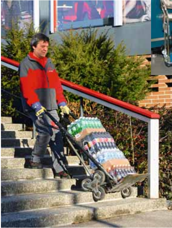
Figura 13 Utilizzate mezzi ausiliari, ad es. un pratico carrello saliscala ...