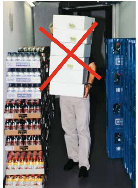
Figura 12 Spesso i pacchi vengono accatastati uno sopra l'altro, bloccando in questo modo la visuale. Attenzione, poiché camminare alla cieca su e giù per le scale può diventare molto pericoloso. Quindi, fate in modo di avere sempre la visuale libera!