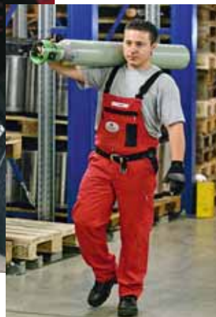
Figura 8 Il modo migliore per trasportare i sacchi e le bombole è appoggiarli sulle spalle, tenendo la schiena ben dritta!

I corsi tenuti dalla Lega Svizzera contro il reumatismo e da fisioterapisti qualificati possono fornirvi utili consigli su come trasportare correttamente i carichi.