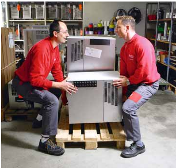
Figura 15 In due va molto meglio.