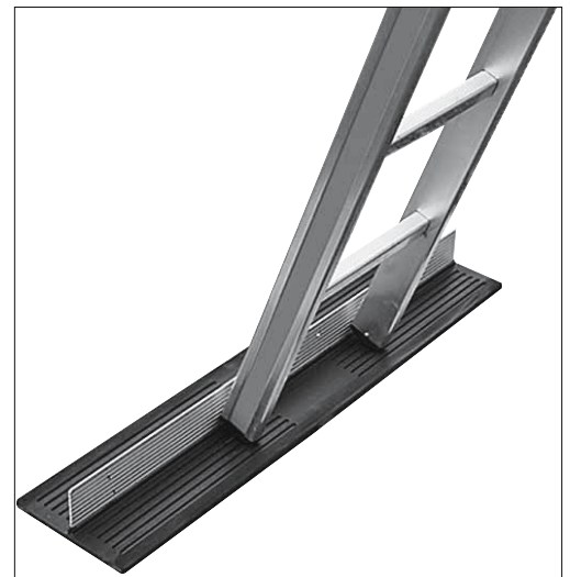
Fig. 2: con una base adeguata (ad es. tappetino antiscivolo) si impedisce che i piedi della scala scivolino.