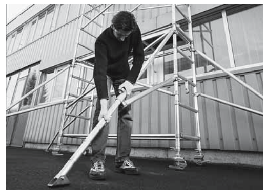
Fig. 3: dispositivo per evitare il ribaltamento del ponteggio mobile.