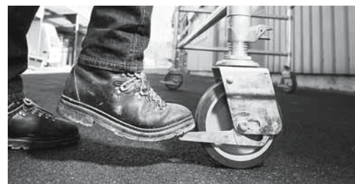
Fig. 4: prima di salire bloccare i freni delle ruote.

Consultare anche la lista di controllo «Ponteggi mobili su ruote» (codice 67150.i)