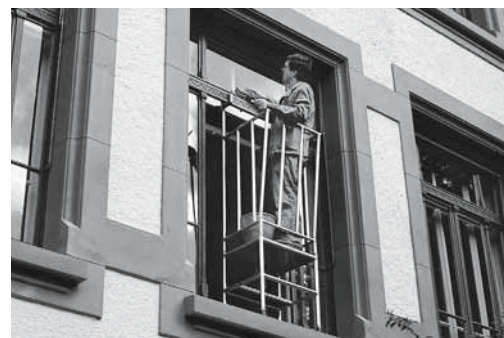
Fig. 6: Parapetto di protezione agganciato tra la finestra e il telaio.

Consultare anche le liste di controllo «Utensili elettrici portatili» (codice 67092.i), «Elettricità sui cantieri» (codice 67081.i) e «Pavimenti» (codice 67012.i)