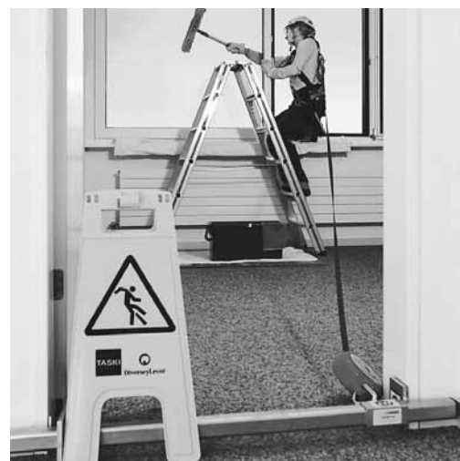
Fig. 7: pulizia delle finestre. La persona è munita di un dispositivo anticaduta di tipo retrattile. L'apparecchio è fissato ad una traversa agganciata al telaio della porta.