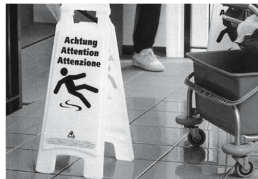
Fig. 5: segnale che indica un pavimento scivoloso. Questo cartello può essere ordinato spesso la Suva (codice 6228).

Consultare anche le seguenti pubblicazioni Opuscolo «Sostanze pericolose – Tutto quello che è necessario sapere» (codice 11030.i), lista di controllo «Protezione della pelle sul posto di lavoro» (codice 67035.i), film «Napò e le sostanze pericolose» (codice DVD 351)