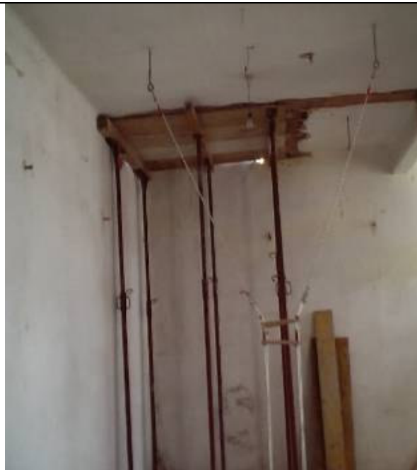
Immagine soluzione sicura

D.Lgs.n. 81/2008 Titolo IV°: · Art. 107 definizione lavoro in quota · Art. 111 Obblighi del datore di lavoro nell'uso di attrezzature per lavori in quota Art. 115 Sistemi di protezione contro le cadute dall'alto Art. 122 Ponteggi ed opere provvisorie Art. 123 Montaggio e smontaggio delle opere provvisorie Art. 146 Difesa delle aperture Art. 148 Lavori speciali