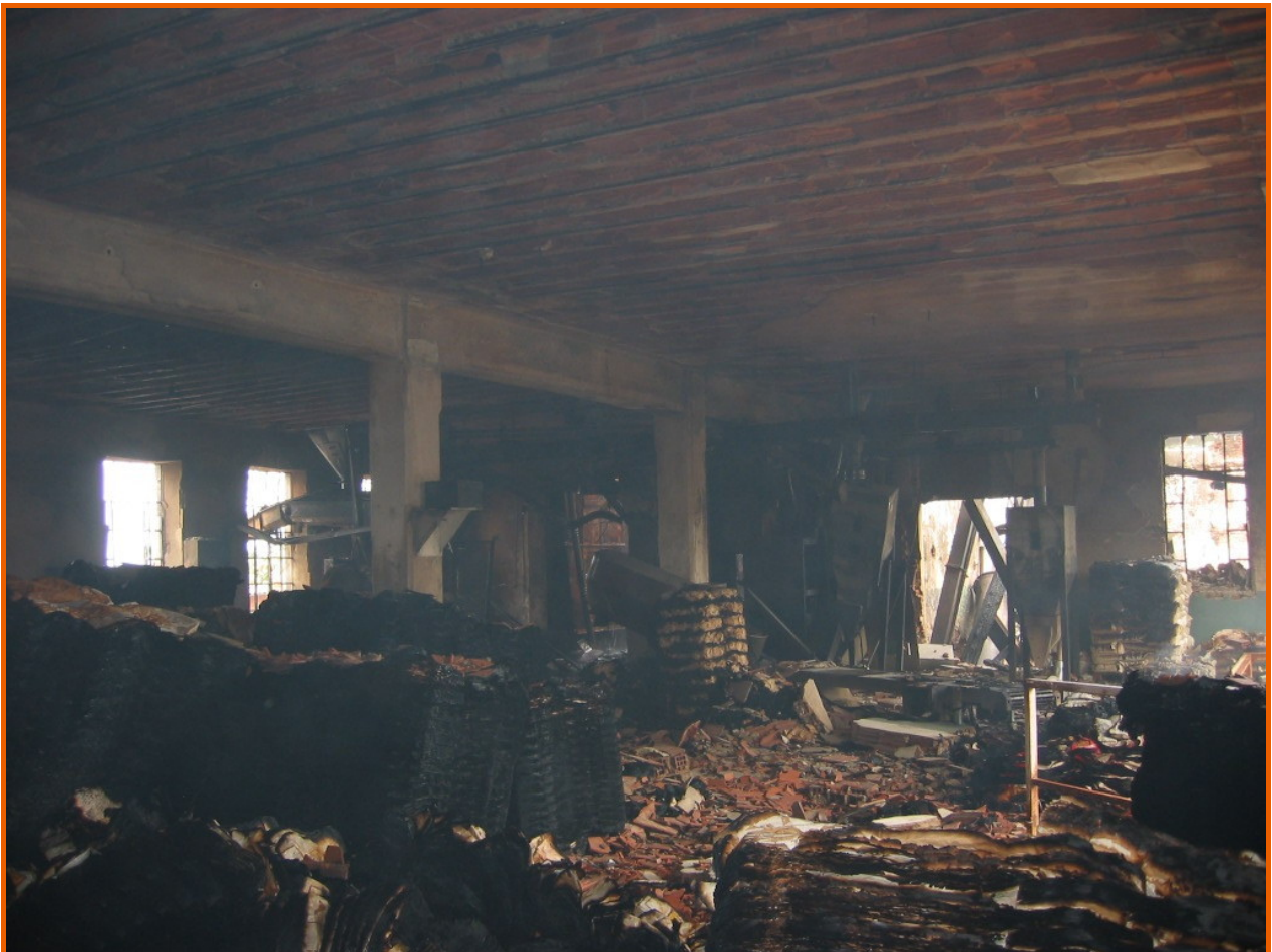
Veduta complessiva del magazzino