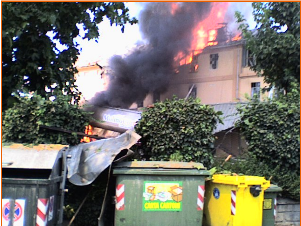
Corpo centrale dell'edificio in fiamme, visto da via Paglieri