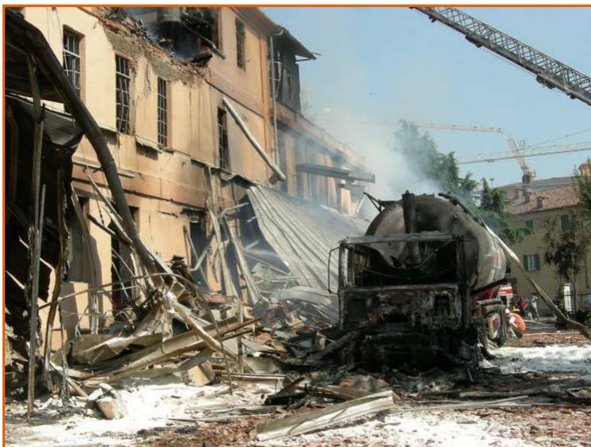
Corpo centrale dell'edificio e autocisterna nel cortile interno, a incendio controllato