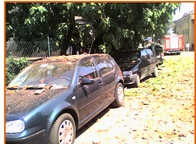
Autovetture parcheggiate in via Paglieri colpite dalle macerie proiettate dall'esplosione