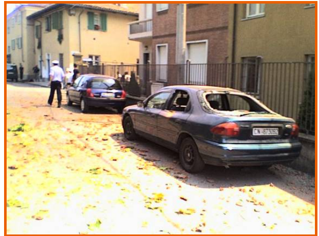
Autovetture parcheggiate in via Paglieri con i vetri rotti