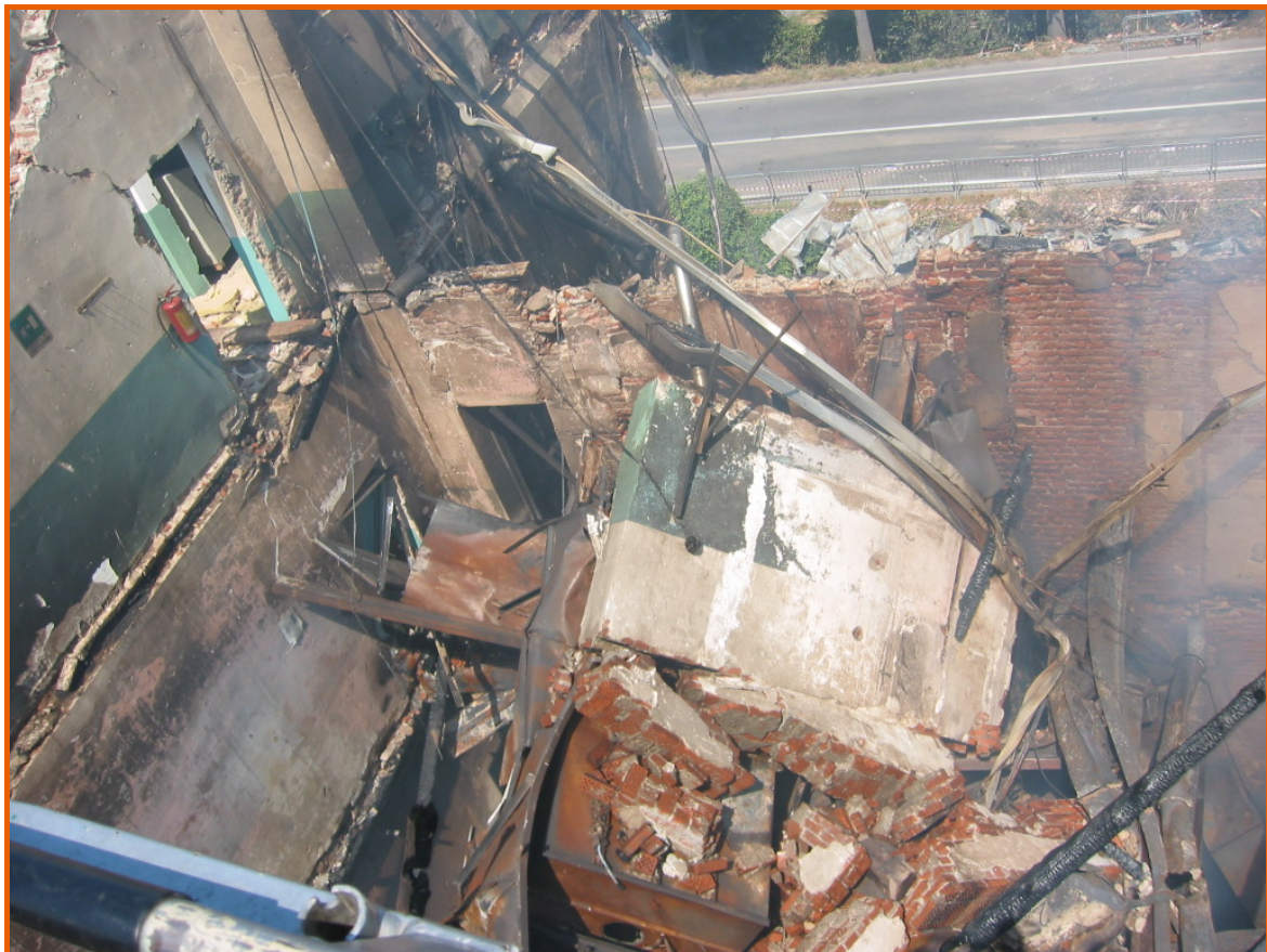
Veduta dall'alto della zona che si affaccia sul cortile interno, in via Paglieri. Nella parte alta si nota via Torino