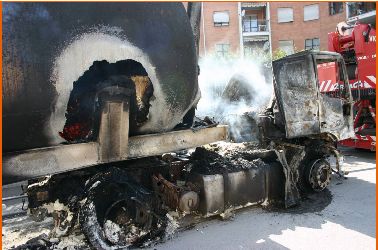
Foro dell'autocisterna con la farina incandescente