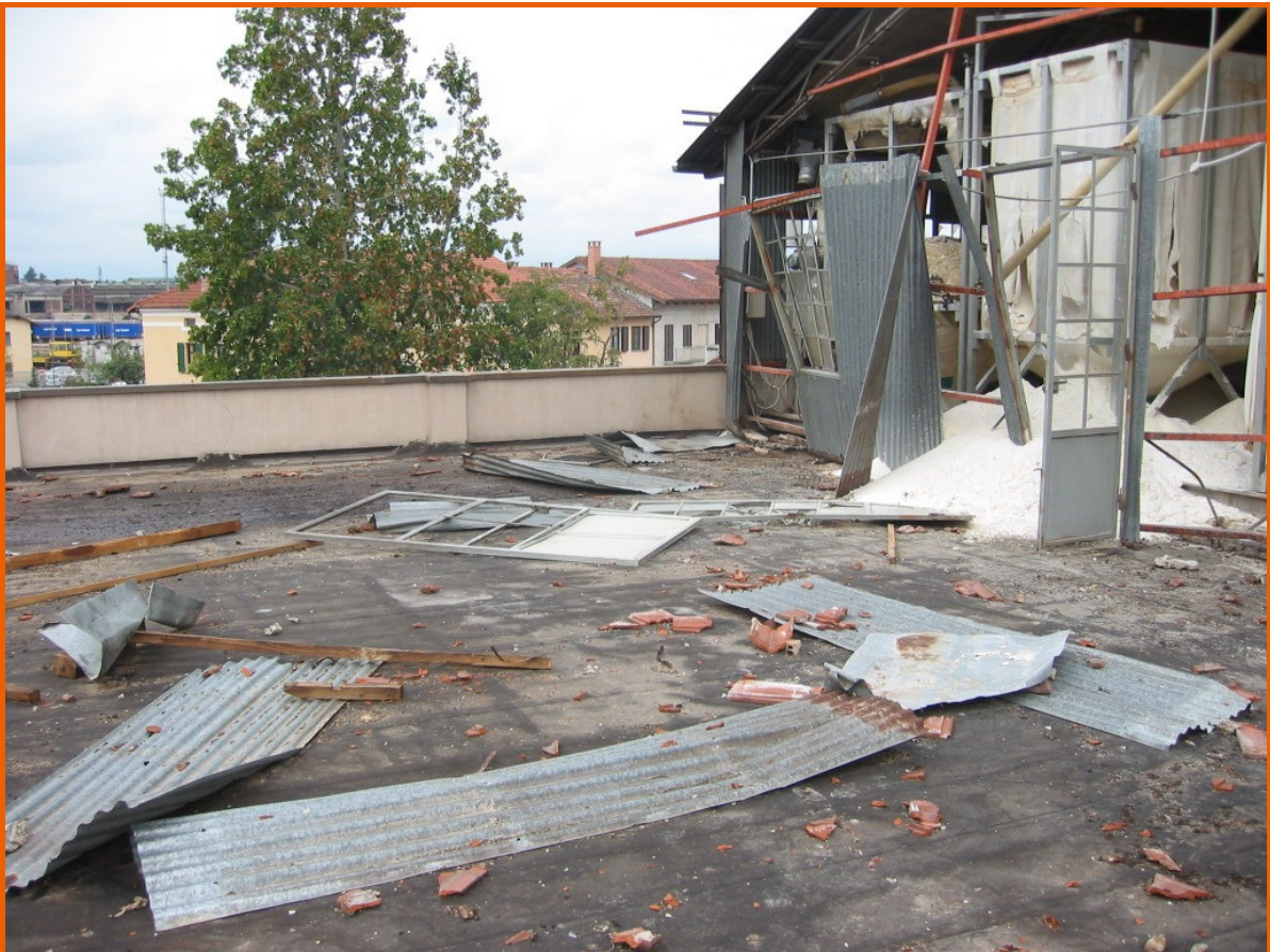
Tetto accessibile attraverso la scala antincendio sul lato dell'edificio verso via Torino