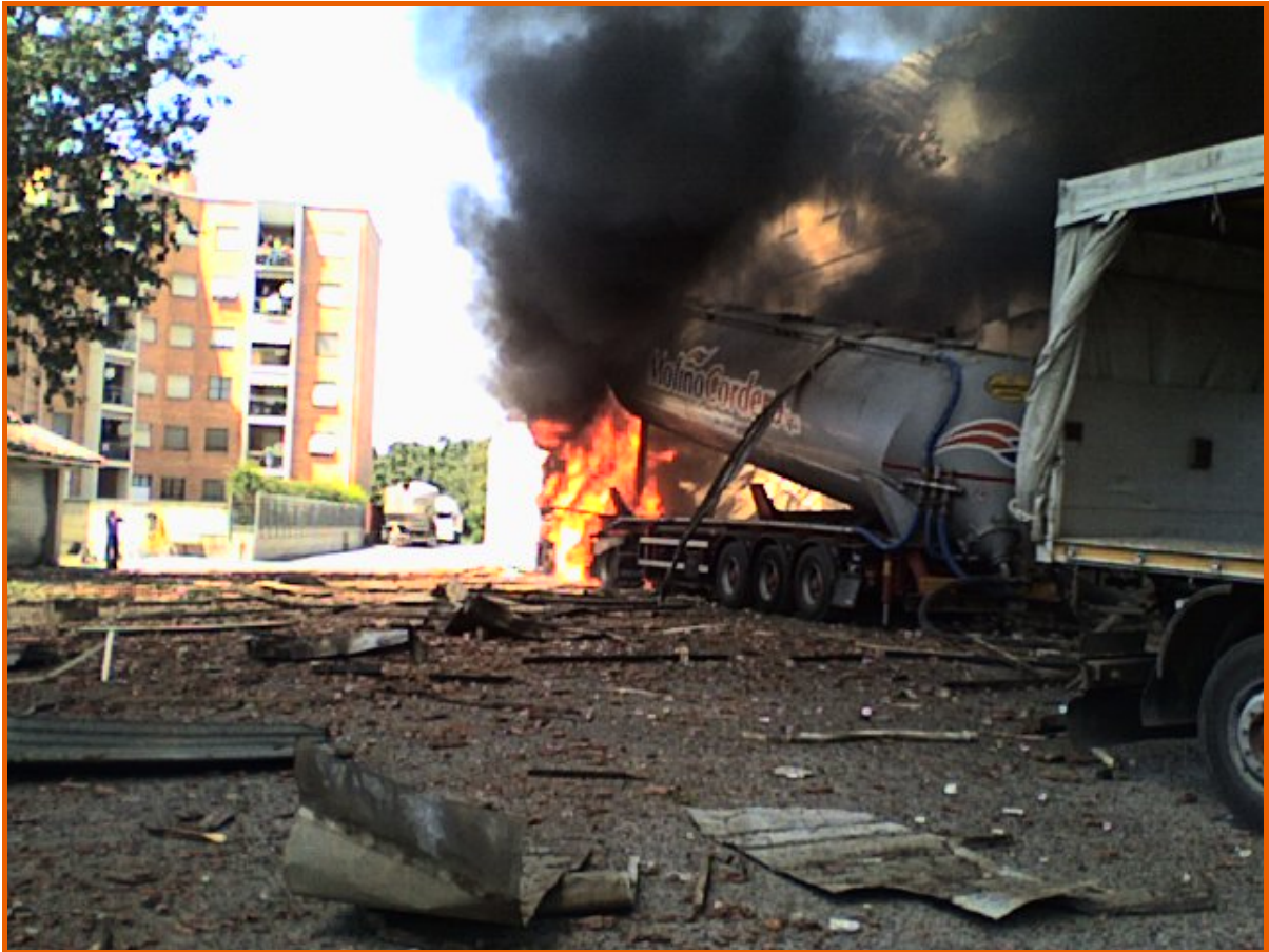
Autocisterna in fiamme, nel cortile interno, vista da via Paglieri