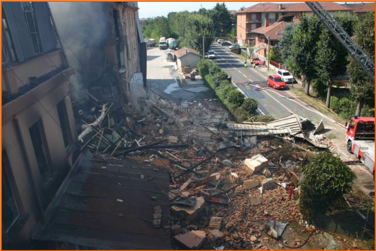
Veduta complessiva dall'alto delle macerie su via Torino