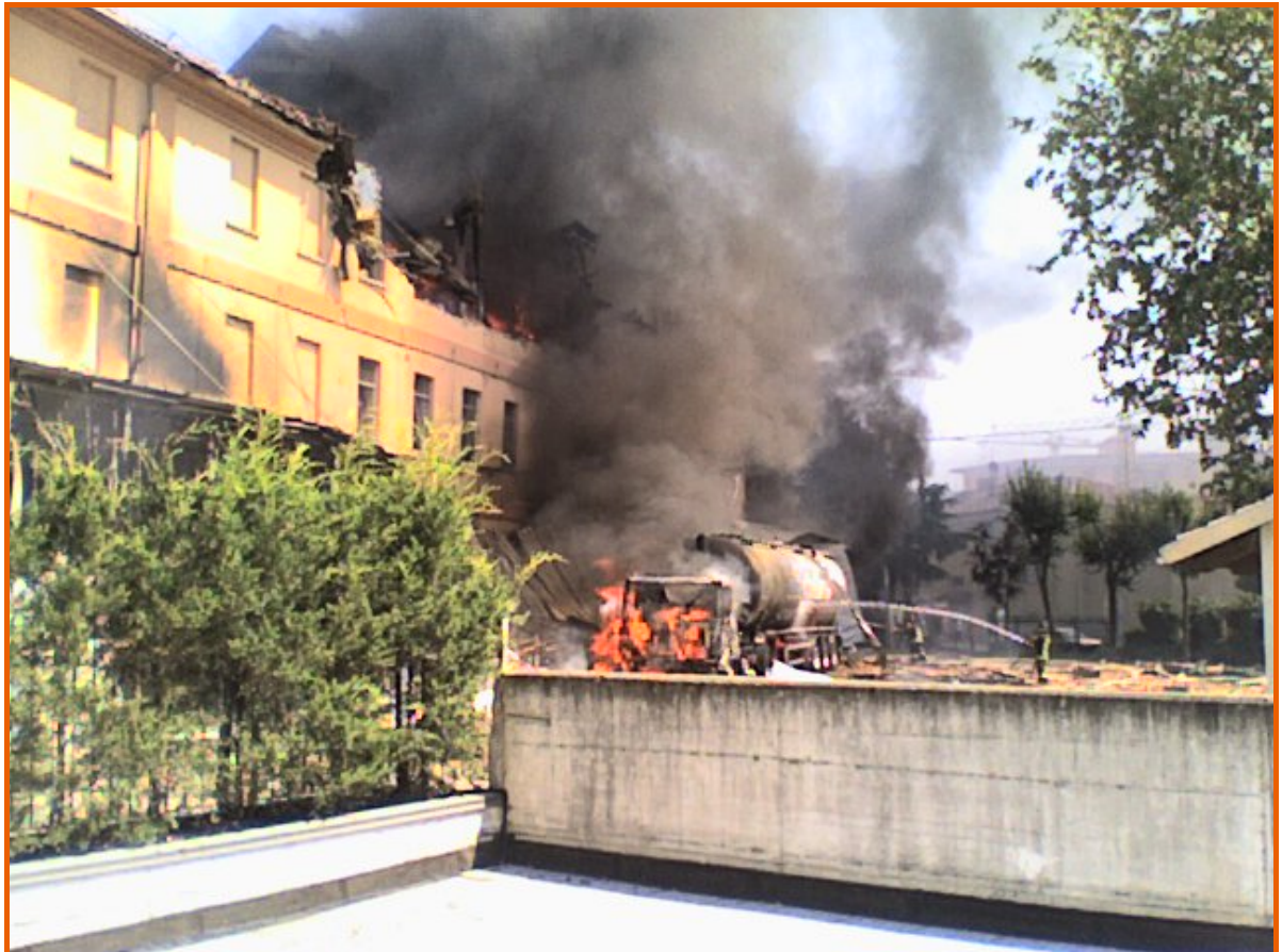
Corpo centrale dell'edificio, autocisterna in fiamme e cortile interno del mulino visti dal condominio di fronte in via Paglieri