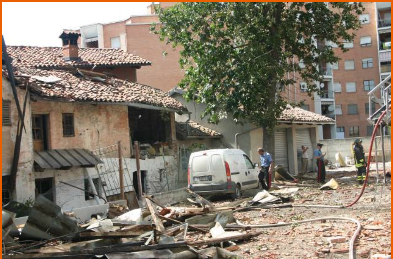
Cortile interno del mulino in via Paglieri con listelli in legno, lamiere del tetto, tegole e altre macerie proiettate dall'esplosione. Sullo sfondo, un condominio in via Paglieri, con vetri rotti e tapparelle risucchiate all'esterno dall'onda d'urto