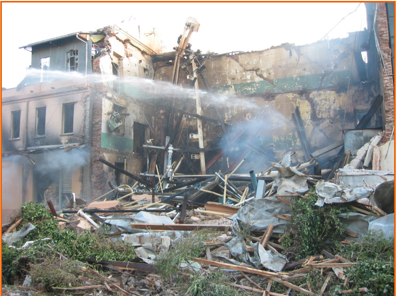
Corpo centrale dell'edificio su via Torino con gli impianti di molitura