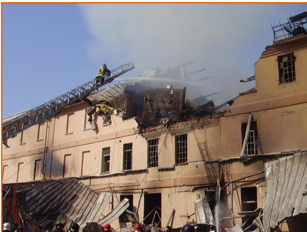
Corpo centrale dell'edificio, visto da via Paglieri, a incendio controllato