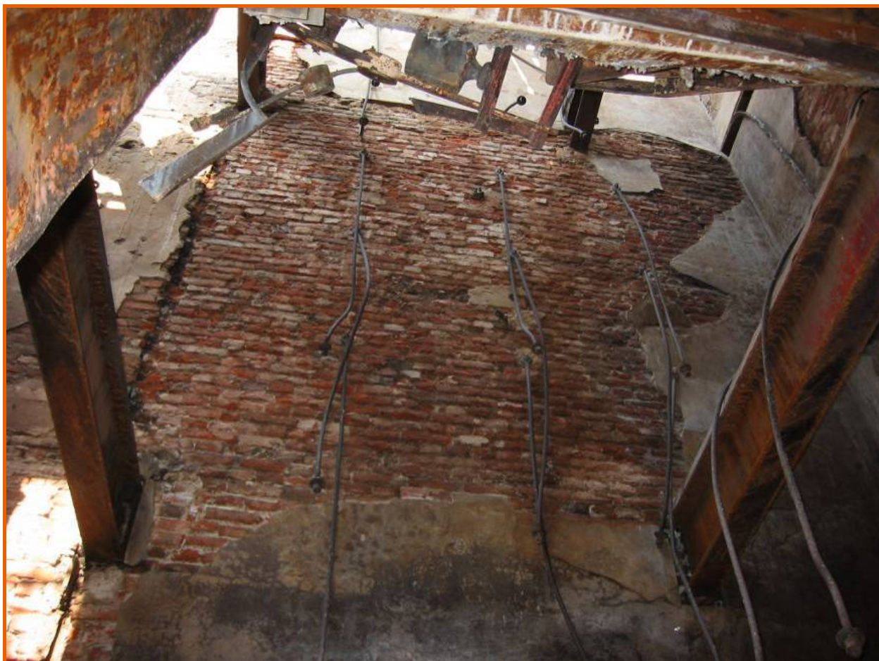
Interno del silos-farineria in legno del corpo centrale del mulino