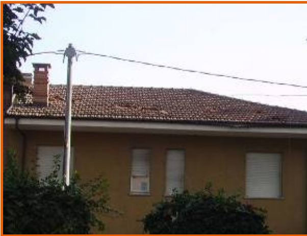
Tetto di una palazzina in via Paglieri colpito dalle macerie proiettate dall'esplosione