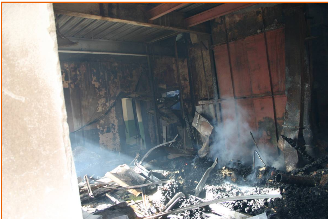
Area del montacarichi e dell'ufficio con la bilancia al piano terra del corpo centrale del mulino