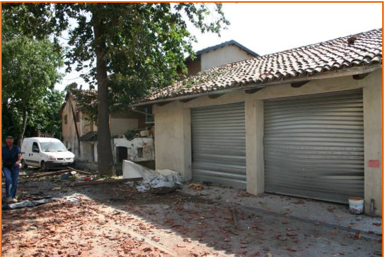
Due garage con tapparelle risucchiate all'esterno dall'onda d'urto