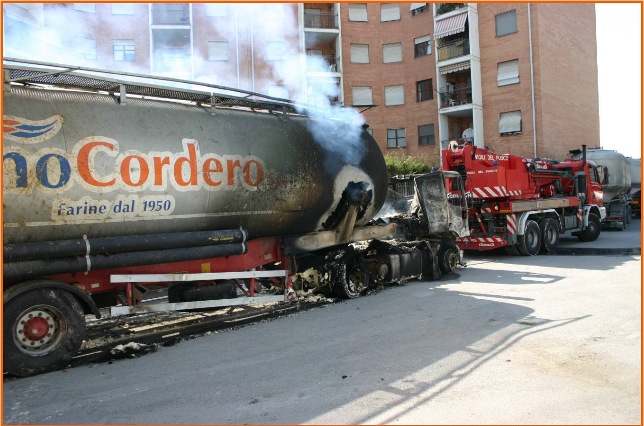
Autocisterna trainata in un angolo del cortile interno