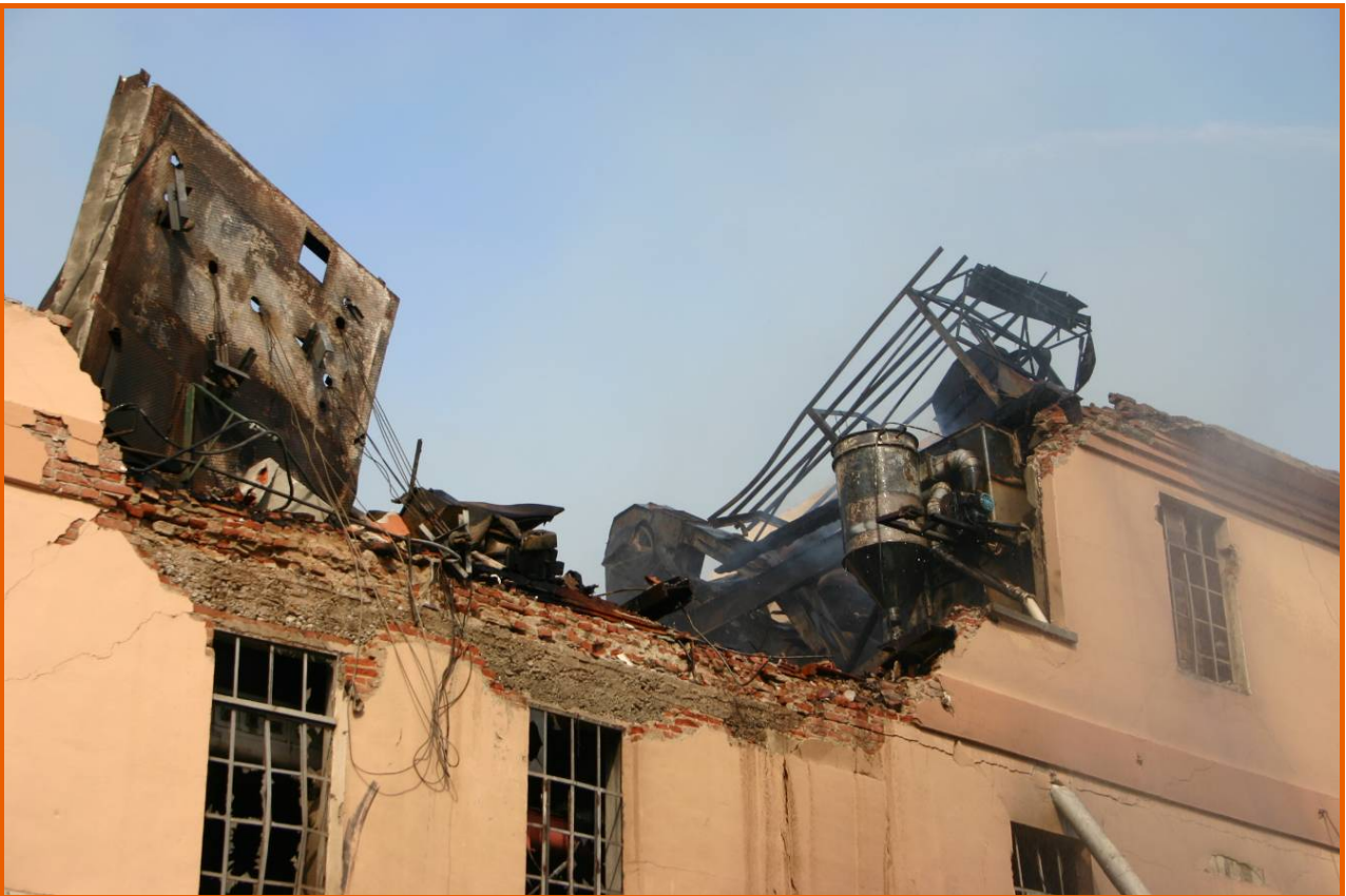
Piattaforma superiore del montacarichi, rovesciata di 90° rispetto alla posizione orizzontale di origine