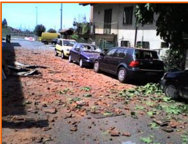
Autovetture parcheggiate in via Paglieri con i vetri rotti