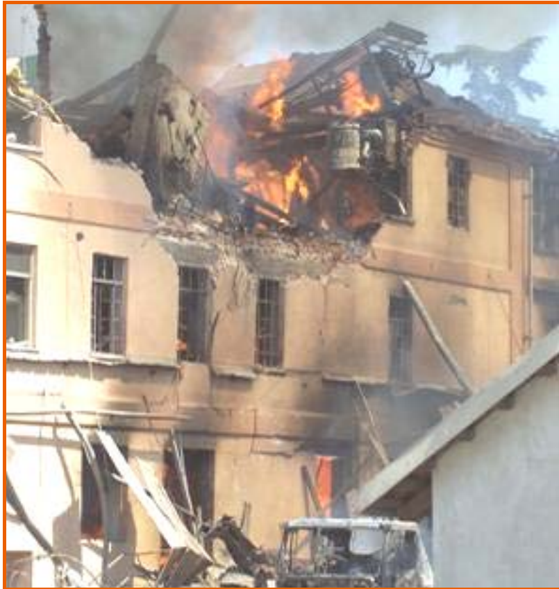
Corpo centrale dell'edificio dal lato cortile, con ingresso da via Paglieri