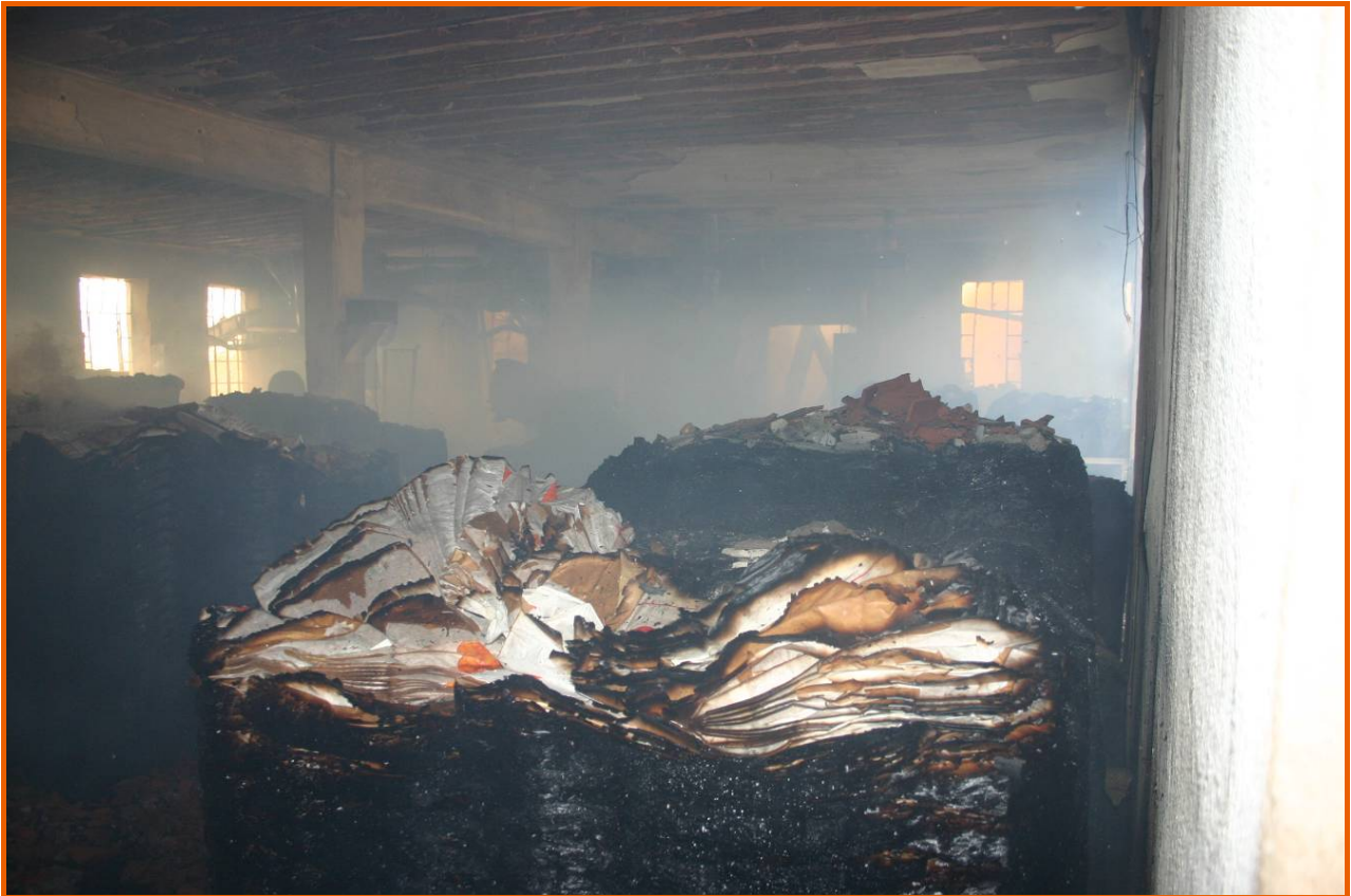
Magazzino con i pallet di sacchi di farina ancora da riempire