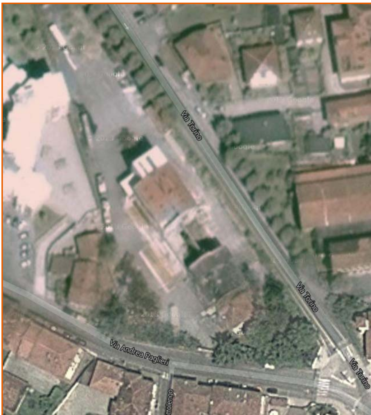
Vista dall'alto dell'area del Molino Cordero tra via Torino e via Paglieri - Fossano (CN)