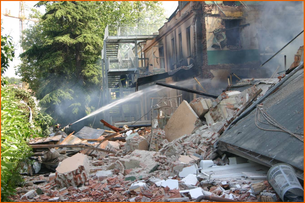
Veduta complessiva delle macerie su via Torino