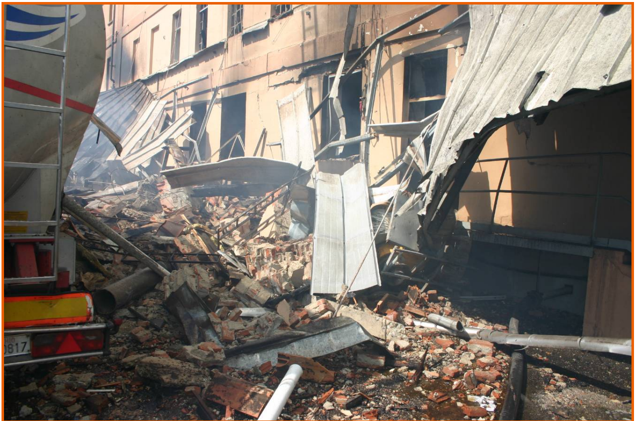
Piano terra del corpo centrale del mulino