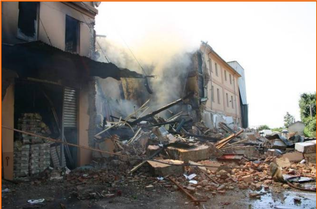
Corpo centrale dell'edificio su via Torino con gli impianti di molitura. In basso a sinistra, si nota una parte del magazzino con i pallet di sacchi di farina