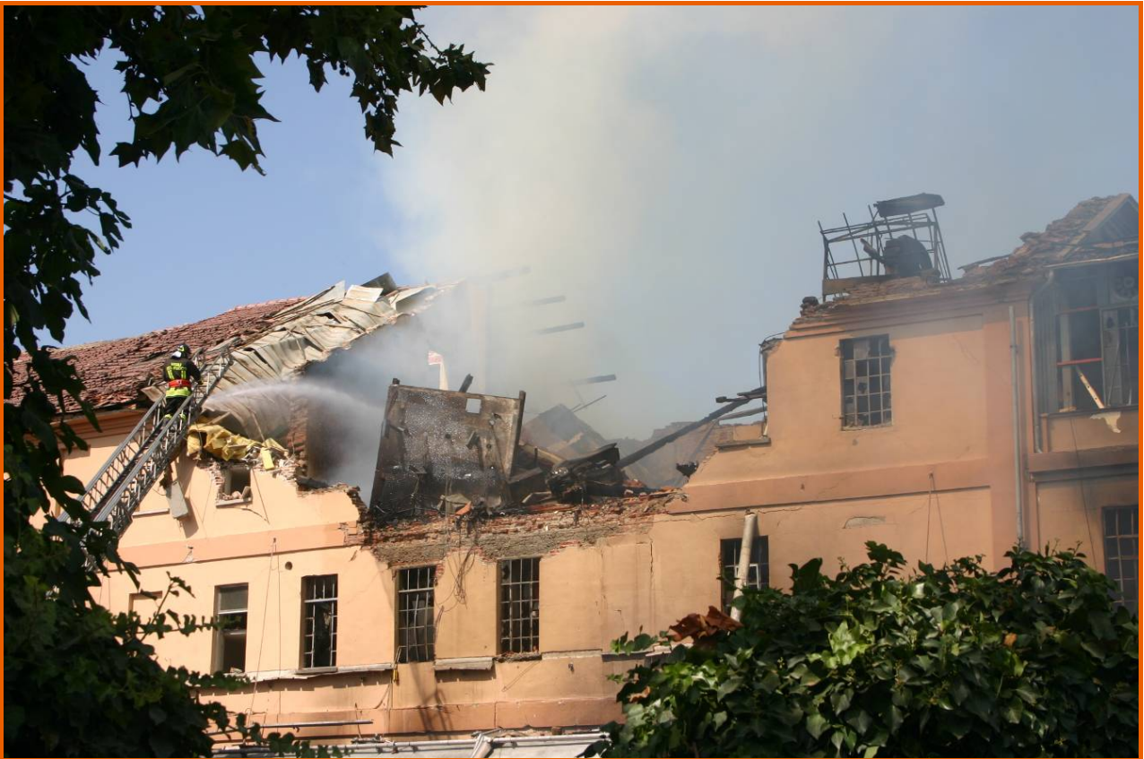
Corpo centrale dell'edificio, visto da via Paglieri, a incendio controllato