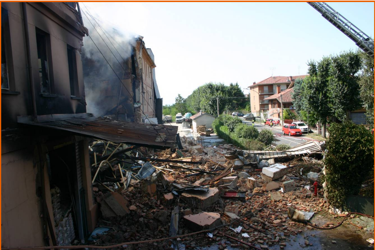
Veduta complessiva delle macerie su via Torino