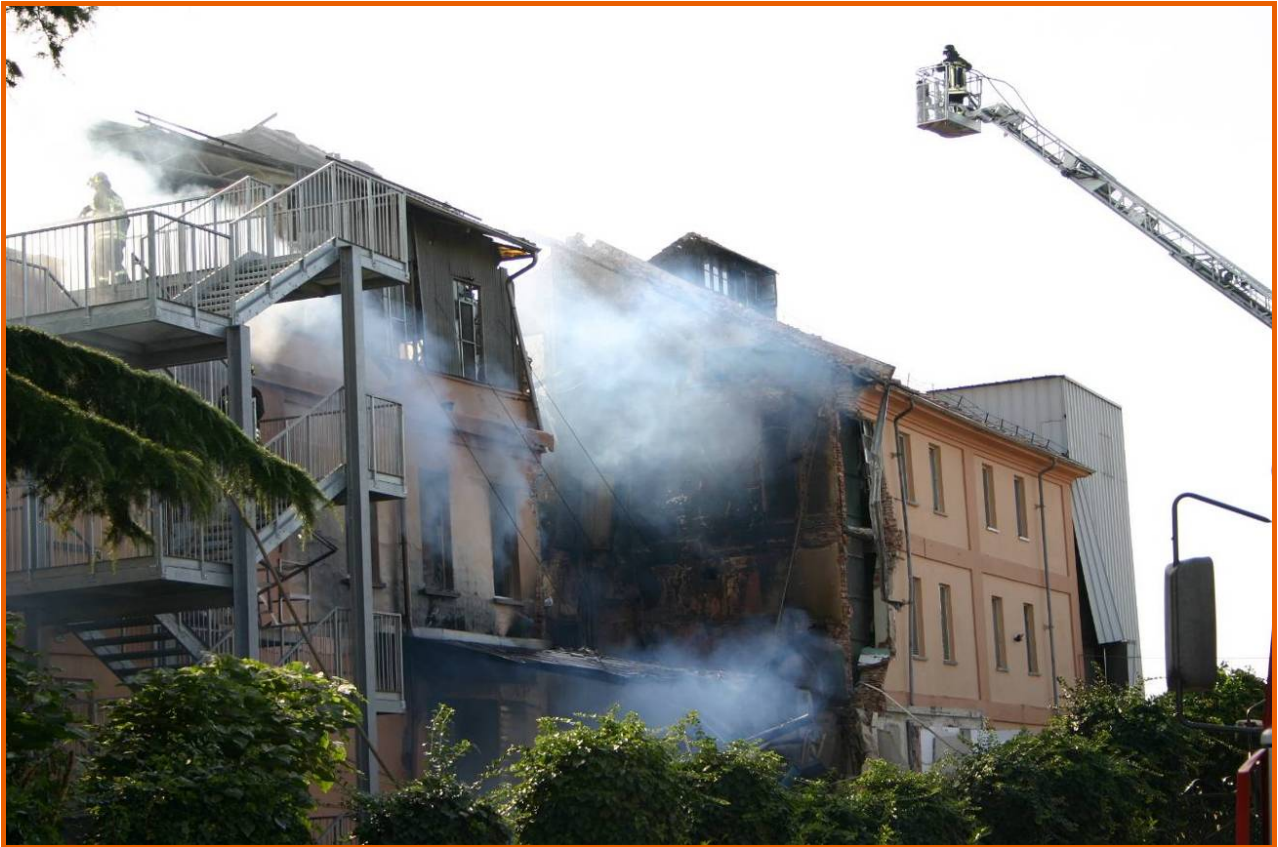
Corpo centrale dell'edificio su via Torino con gli impianti di molitura