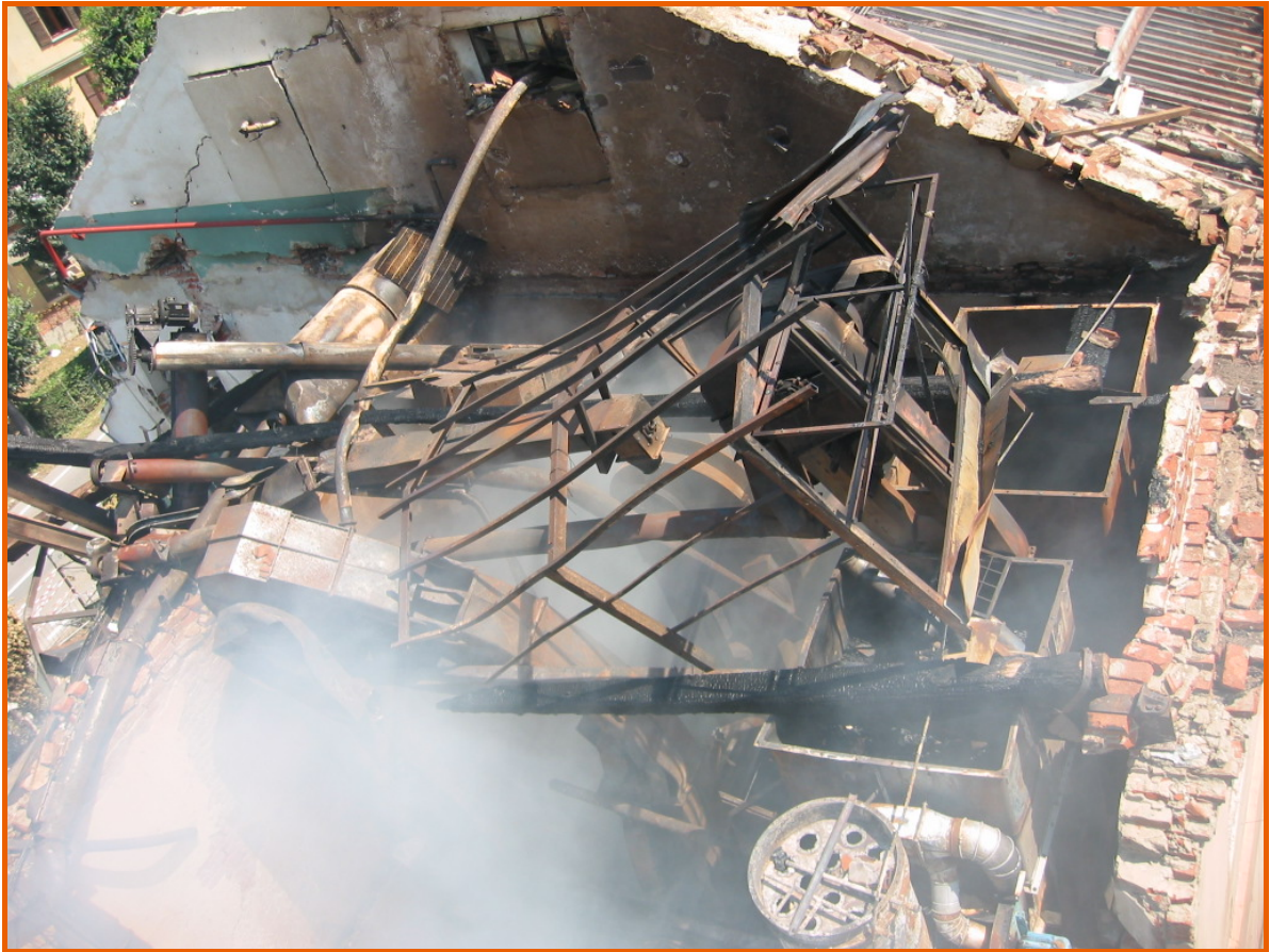
Veduta dall'alto della zona: sulla sinistra il lato di edificio che si affaccia su via Torino e sulla destra il lato di edificio che si affaccia sul cortile interno verso via Paglieri