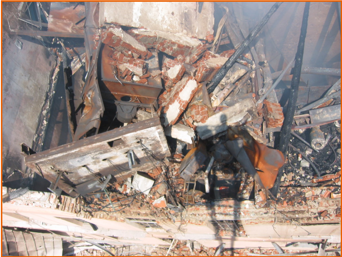
Veduta dall'alto della zona che si affaccia sul cortile interno. Da un confronto con la fotografia precedente, si nota la piattaforma superiore del montacarichi