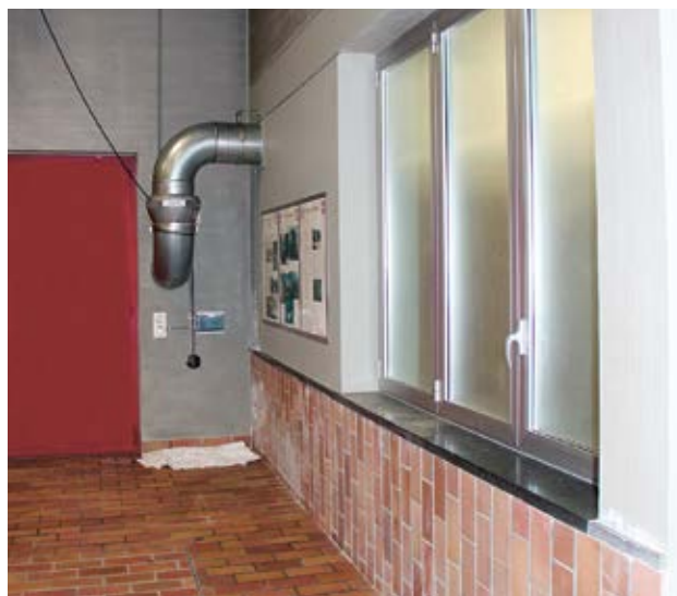
Fig. 6 e 7 i locali con elevata concentrazione di radon vengono chiusi ermeticamente.