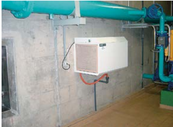
Fig. 2 deumidificatore con filtro dove è possibile l'accumulo di prodotti di decadimento del radon

Un'ulteriore fonte di pericolo è data dai filtri degli impianti di ventilazione e dei deumidificatori (fig. 2): dato che i prodotti di decadimento del radon si attaccano alle particelle in sospensione, essi vengono aspirati e si depositano sui filtri. Chi entra in contatto con questi filtri (ad es. per sostituirli) può esporsi a un rischio di contaminazione e assorbimento delle sostanze radioattive.