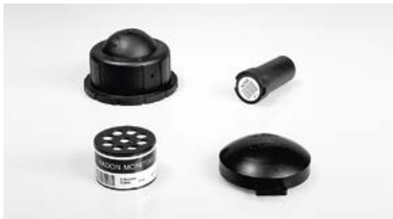
Fig. 3 esempi di dosimetri per radon