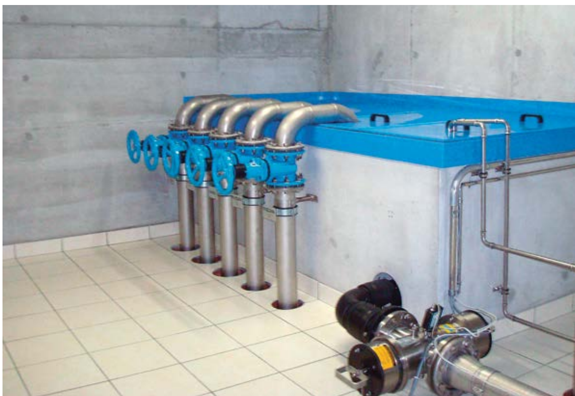
Fig. 4 e 5 il radon viene fatto uscire dall'acqua tramite degassazione.